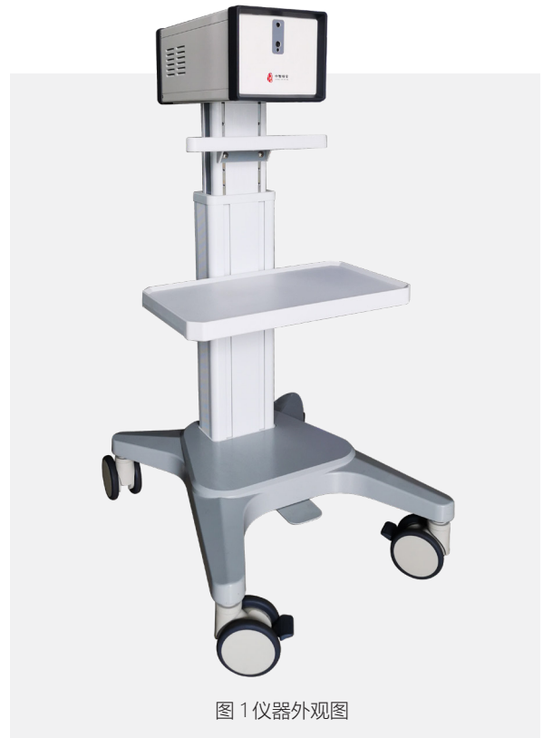
图 1 仪器外观图

• 数据管理：完成数据信息管理工作，包括：人员信息的录入与检索；检索历史数据记录；查看检测报告，打印诊断报告等功能。